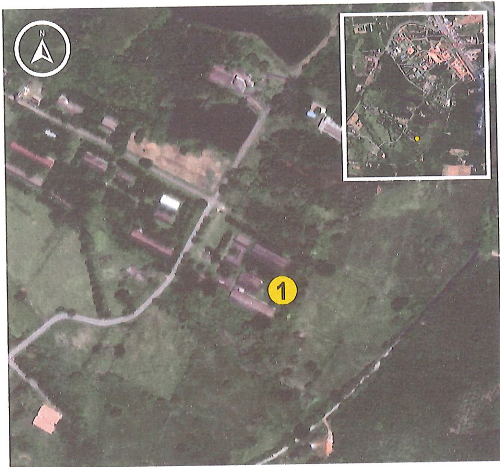
1 โรงเรือนอัจฉริยะด้านการเลี้ยงสุกร : หลักสูตรสัตวศาสตร์